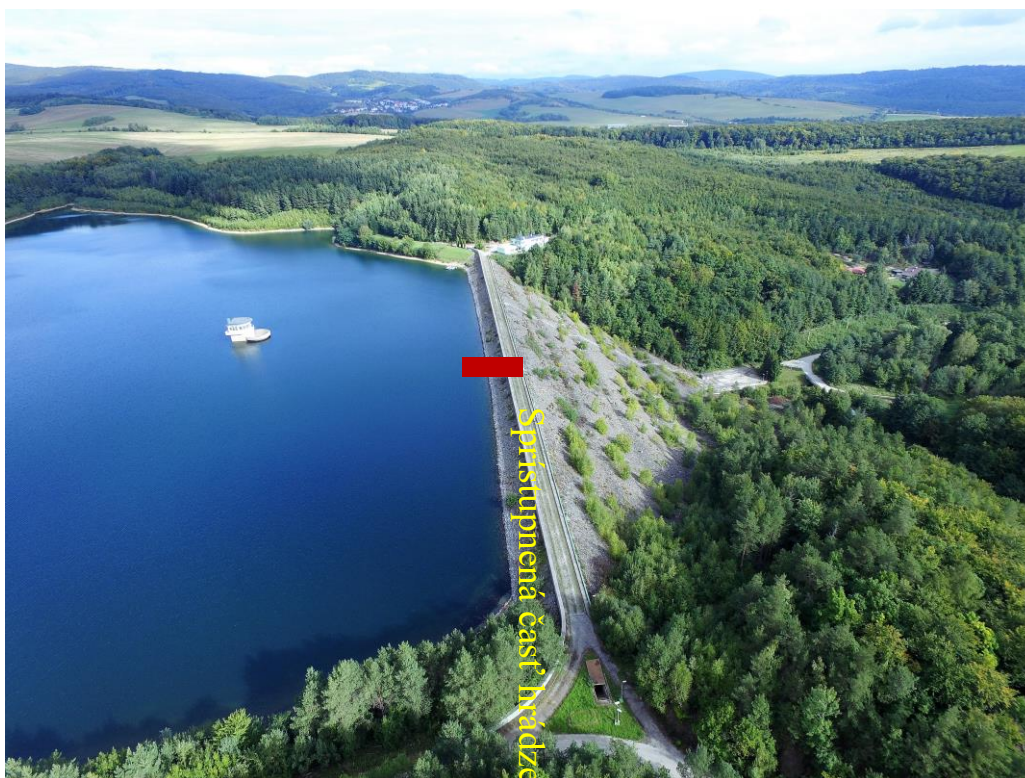
Vyznačenie prístupnosti časti koruny hrádze (po červený obdĺžnik).