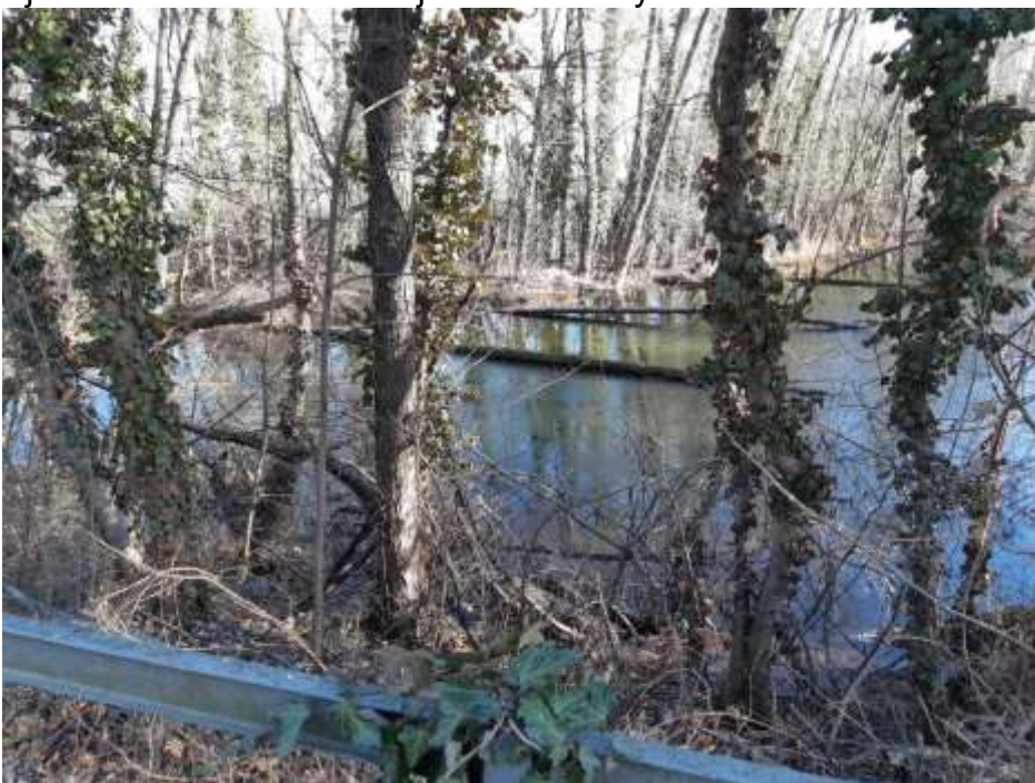
Niektoré zúženia môžu byť pre vodný habitat prínosom