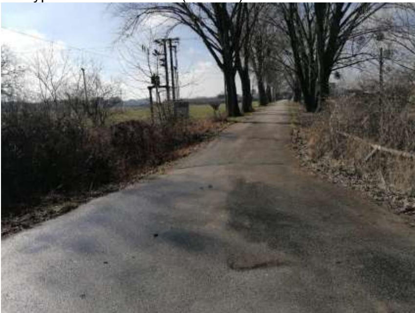
Neošetrované hlavové vřby na ramene Soliari