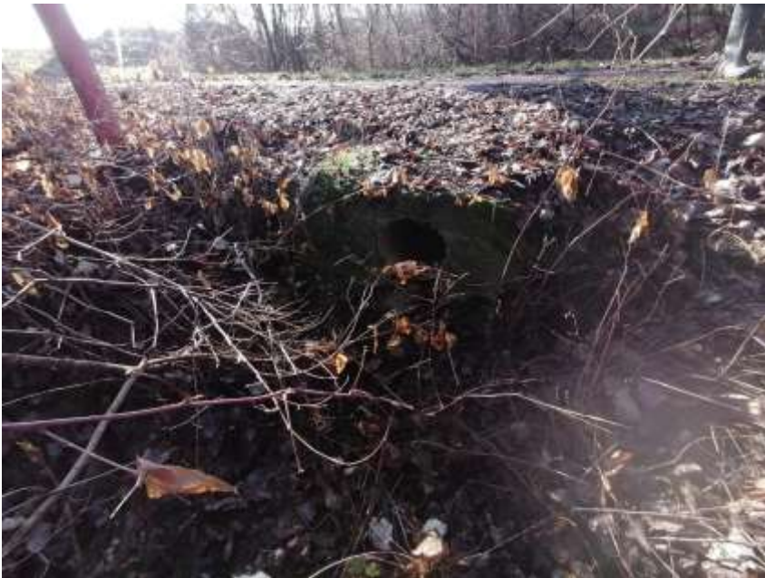
Presyp na ramene Soliari (k farme)