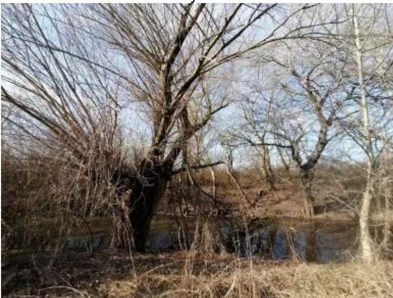
Suché koryto ramena Soliari v blízkosti vtoku z Klátovského ramena – vyžaduje minimálne zásahy s predpokladaným veľkým ekologickým prínosom